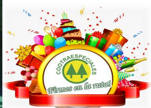
COTRA de cumple