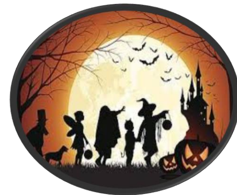
Celebración de Halloween