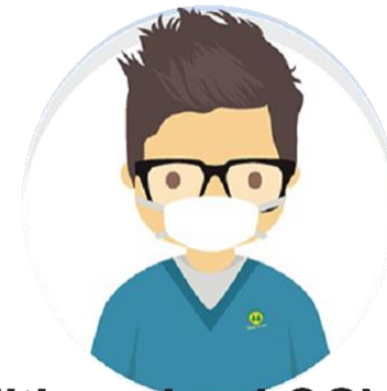
Mitigando el COVID.